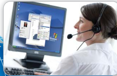
CA BASIC EXPRESS