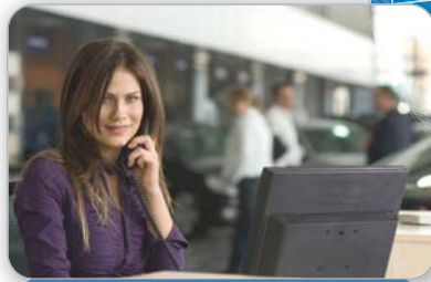
CA OPERATOR KONSOLE